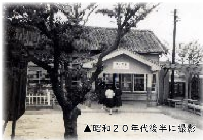
▲昭和20年代後半に撮影