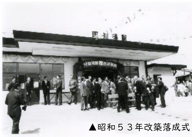
▲昭和53年改築落成式