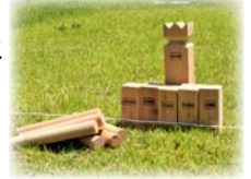
▲スウェーデン発祥の新投げゲーム