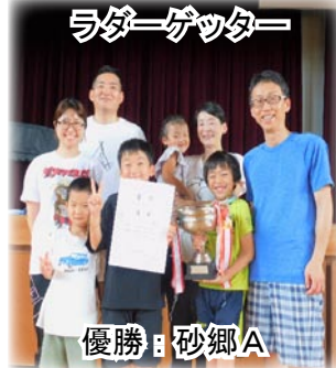
ライダーゲッター