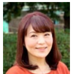
原田 かおり (フリーアナウンサー)