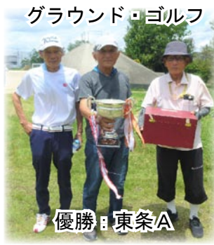
グラウンド・ゴルフ