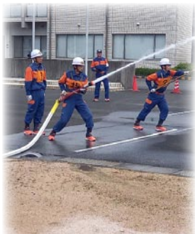
▲阿知須方面隊 阿知須分団

阿知須地域からは、阿知須方面隊阿知須分団が参加され、日頃の訓練の成果を発揮していました。